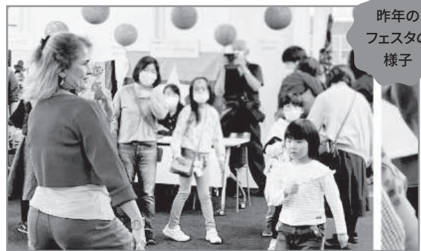
昨年の フェスタの 様子